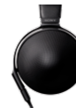
ステレオヘッドホン MDR-Z1R オープン価格