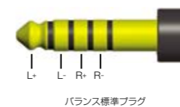
バランス標準プラグ

通常のヘッドホンケーブルに加え、JEITA（電子情報技術産業協会）にて新たに統一規格化されたφ4.4mmバランス標準プラグを使用したケーブルを付属。別売のバランス接続対応のウォークマン®（NW-WM1Z/WM1A）、ヘッドホンアンプ（TA-ZH1ES）等と接続することで、より高音質な音楽再生が可能です。