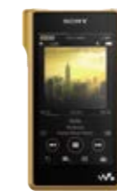
ウォークマン® NW-WM1Z / NW-WM1A オープン価格

ソニーがこれまで培ってきたすべての高音質技術をベースに、従来の常識にとられない音作りが結実した「Signature Series」。ウォークマン®、ヘッドホン・ヘッドホンアンプ、この3種のフラッグシップが追求したのは、演奏が始まる瞬間、歌い出しの気配から最後の音が消え入り完全な静寂に至るまでの「微小音の再現性」です。その現場の空気、温度や湿度までを感じられるほどの表現力によって、ヘッドホンによる今考えうる最高の音楽体験を、そして音質の追求の先にある音楽の感動を余すところなく届けることを目指しました。