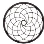
フィボナッチパターングリル

ドライバーユニットのグリルは、フィボナッチ数列を参考にした曲線のパターンとし、開口を均等化。また、高剛性材料の採用により棧を可能な限り細くすることで、空気の伝搬を阻害せず、なめらかな超高域特性とすることができました。色付けの少ない、ハイレゾ音源の忠実な再生を実現します。