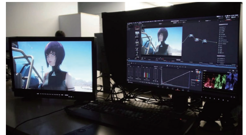
SOLA DIGITAL ARTS でのプレビュー時、左が PVM-X2400

高橋様 ：ノウハウの蓄積と PVM-X2400 の導入でモニタリング環境が整い、現場で意図した通りの HDR 映像をポスト・プロダクションでも再現できるようになりました。これによって、現場では技術的な心配をすることなく映像の演出クオリティそのものに集中できるので、とても助かります。