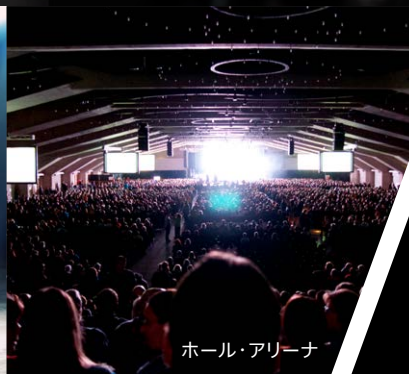
ホール・アリーナ