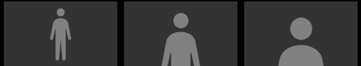
あらかじめ設定した構図を登録しておきオペレーション画面から簡単な操作で呼び出すことができる。(最大3種類まで) また、追尾中の構図変更も可能です。