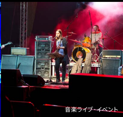
音楽ライブ・イベント