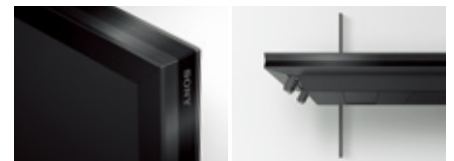
側面配置のソニーロゴ

表示コンテンツを引き立てるよう、ソニーロゴは目立たない側面に配置しました。上下左右のベゼル幅はすべて均等なため、横置き時はもちろん縦置きにした場合もスタイリッシュ。また設置や移動の際には、本体裏のキャリーハンドルが役立ちます。