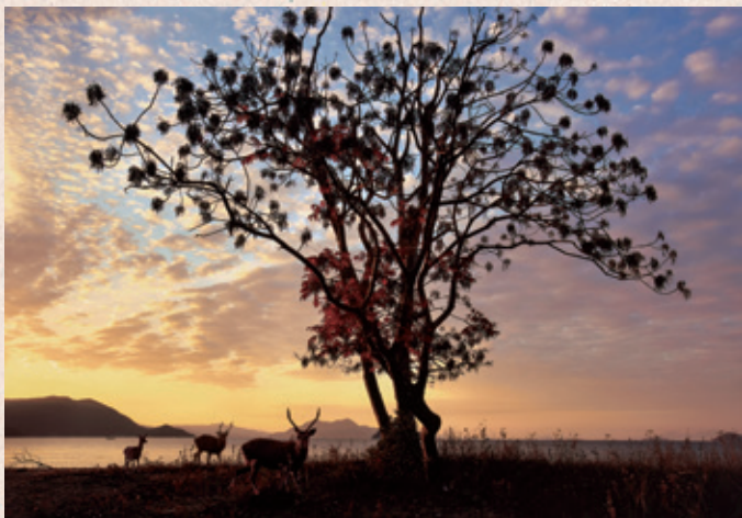
第33回 ソニー 4K賞「夜明の入浜」藤岡博司