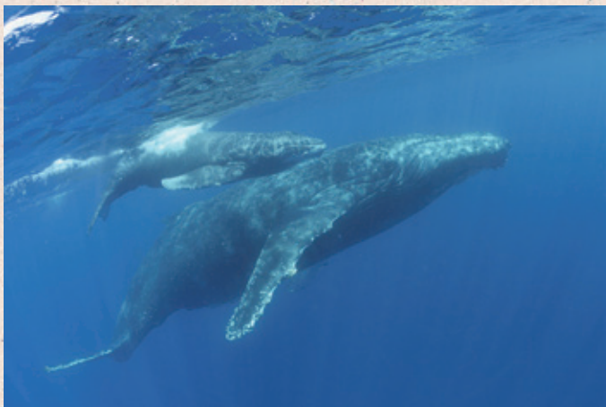
第33回 ソニーネクストフォトグラファー賞「親子の旅路」小林ゆうみ