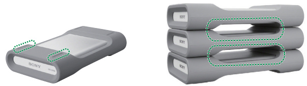
カバー表面の凹凸形状で安定した積み重ねが可能

*8 当社にて、気温 25℃ の環境で 3 台積み重ねて PC に接続し、安全性、データに問題ないことを確認しています。