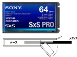
専用ハードケース

SxSメモリーカードは、ExpressCard™規格のうちコンパクトなExpressCard/34タイプを採用し、従来のPCカード型フラッシュメモリーと比較して大きさが約1/2小型化を実現することで、カムコーダー本体の小型化・軽量化に貢献しています。