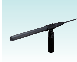
エレクトレットコンデンサマイクロホン ECM-678/9X 希望小売価格 80,000円＋税 鋭指向性・高感度・低雑音のマイクアプセルを採用