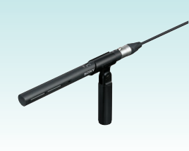
エレクトレットコンデンサマイクロホン ECM-VG1 希望小売価格 23,000円＋税 フィールド録音、スタジオ録音用として、新開発ウインドスクリーンを付属し、軽量・コンパクトにまとめたショットガンマイク