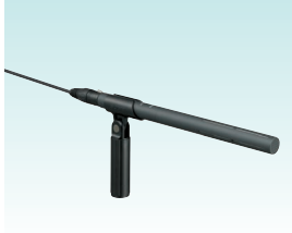
エレクトレットコンデンサマイクロホン ECM-674/9X 希望小売価格 40,000円＋税 鋭指向性であり、乾電池・外部電源の2種類の電源方式に対応