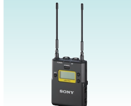
ポータブルダイバーシティチューナー URX-P03 希望小売価格 50,000円＋税 ワイヤレスマイクロホンパッケージUWP-D11、UWP-D12のポータブルチューナー