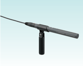
エレクトレットコンデンサマイクロホン ECM-673/9X 希望小売価格 35,000円＋税 屋外での狭角度收音や小型カムコーダーへの搭載など、中距離收音に適したマイク