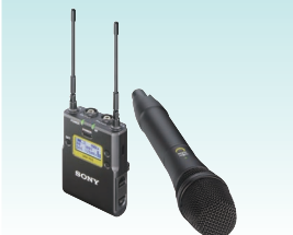
ワイヤレスマイクロホンパッケージ UWP-D12 希望小売価格 78,000円＋税 ハンドヘルドマイクロホンとポータブルダイバーシティチューナーのパッケージ