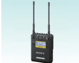
UHFシンセサイザーダイバーシティチューナー URX-P03D 希望小売価格110,000円＋税 2CH同時受信が可能なポータブルタイプのワイヤレスチューナー