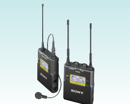
ワイヤレスマイクロホンパッケージ UWP-D11 希望小売価格 78,000円＋税 ボディバックトランスミッターとポータブルダイバーシティチューナーのパッケージ