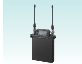
UHFシンセサイザーダイバーシティチューナー URX-S03D 希望小売価格189,000円＋税 カムコーダーにスロットインで装着でき、2CH同時受信が可能なワイヤレスレシーバー