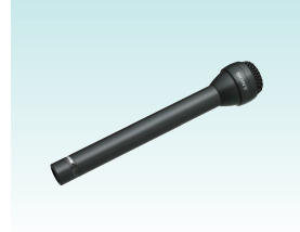
ダイナミックマイクロホン F-112 希望小売価格20,000円＋税 インタビュー・取材用途に適した高感度全指向性マイクロホン