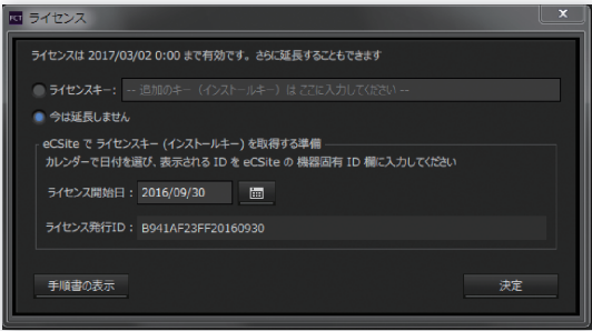
ライセンス認証画面