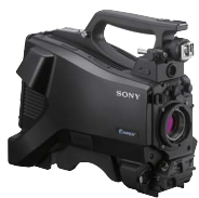
HD ポータブルカメラ HXC-FB75H (本体のみ) 希望小売価格 1,600,000円+税