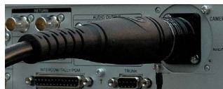
光電気複合ケーブルを接続

カメラとカメラコントロールユニットの接続コネクタに、2種類のケーブルが接続可能な光電気複合コネクタを採用。電源供給可能な光電気複合ケーブルと、シングルモード光ファイバーケーブル（電源供給なし）が接続可能です。