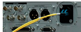
シングルモード光ファイバーケーブルを接続