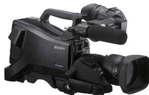
HD ポータブルカメラ HXC-FB75KC (VF、レンズ、マイク付属) 希望小売価格 2,100,000円+税