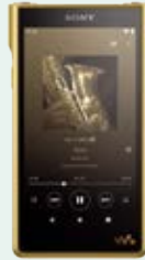
フラッグシップ・ストリーミング WALKMAN® NW-WM1ZM2 NW-WM1AM2