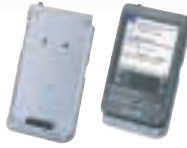
【装着例】 CLIE GEAR 通信アダプター PEGA-CF61 オープン価格*

ワイヤレスでネット接続を可能にする通信アダプター: 「クリエ」に通信カードを装着できる通信アダプターを用意。コンパクトフラッシュ™タイプの通信カードを使って、手のひらからワイヤレスでダイレクトにネットワーク接続が可能です。