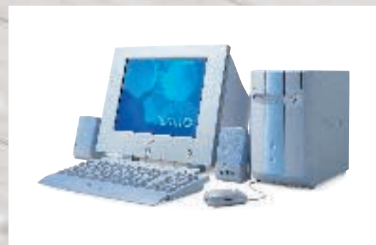
パーソナルコンピュータ 17型FDトリニオンディスプレイモデル