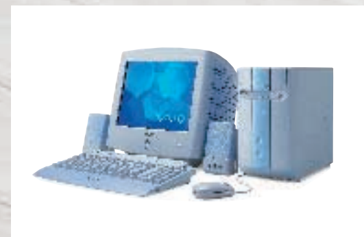
パーソナルコンピュータ 15型FDトリニオンディスプレイモデル