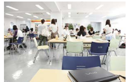
学生たちはVAIOを持ち歩き、授業時間以外でも活発に利用している。

コンパクトなTシリーズは学生にとっても、軽くて持ち運びやすくて良いという声を聞きます。中にはPCに不慣れな学生もいて、Tシリーズがあまり持ちやすいものから、液晶ディスプレイをつかんで持ち上げたり、本の上に乗せたVAIOを片手で運んだり、見ていてはらはらすることを平気でやってしまいます。それで落としたり何かにぶつけたりして壊して持ち込まれることが多いですね。