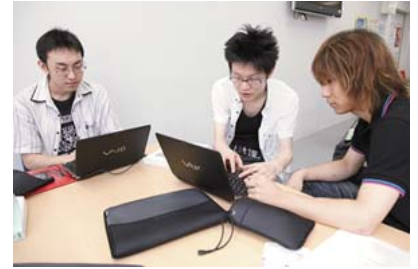
ホールでは課題に取り組む学生の姿が見られる。

学内には無線LANが網羅されており、どこに居てもネット接続ができるので、学生は常にVAIOを持ち歩いて、授業やゼミに出席したりインターネットで情報収集したり幅広く活用しています。机から電源がとれる教室がいくつかあるので、バッテリーが足りなくなってもその場で充電可能です。また自宅に持ち帰って、課題のレポートをまとめる作業などにも使っています。また、大学から学生への連絡は電子メールやグループウェアを使い行っているため、VAIOがないと素早く情報が得られないという状況が起こります。