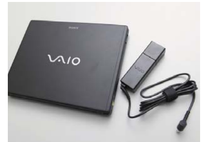
ウォールマウントプラグアダプターを装着した小型ACアダプター。

神戸 モバイルPCでの主な利用法はグループウェアを用いた情報共有です。メールやお知らせ、掲示板やファイル共有などを、Webブラウザから利用しています。セキュリティや管理の面から、モバイルPCにはデータをあまり置かず、サーバーにアクセスして情報を得られるようにしているわけです。外回りをするユーザーは、移動中の交通機関や拠点の中で主に使用していますが、買い取りや品質保証の場合は海外に行くこともあります。ときには店舗内の狭い空きスペースや配送トラックの助手席で使用することもあります。そういう狭い空間でも、コンパクトで軽いVAIOは使いやすいと思います。キーの感触が非常に心地よいのも評価が高いですね。日常的に使う場合は、そういった操作の感触も非常に重要だと思います。