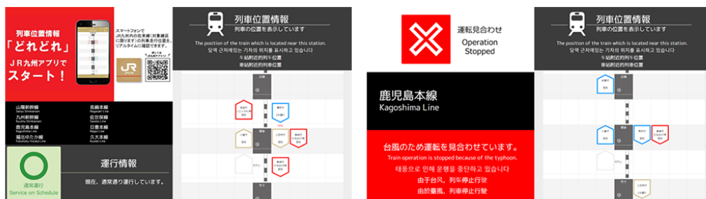
表示画面イメージ

このサイネージシステムでは、平常時はJR九州様のスマホ用アプリ「JR九州アプリ」で配信している運行情報を表示し、輸送障害時には各駅の担当者が操作し、必要な情報提供を行う仕組みとなっています。