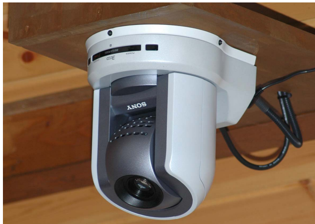
チャペルの天井から、指輪の交換や入場場面を撮影

さらに、これらの2つの施設に設置したリモートカメラとリモートコントロールユニットを光ファイバーケーブルで接続して、1カ所から集中操作しています。