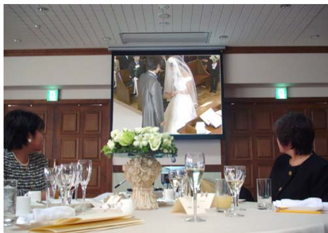
バンケットルームでは、直前まで行われていた挙式の映像をスクリーンに投影