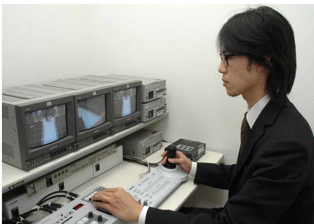
コントロールルームから、3台のカメラをすべて操作可能