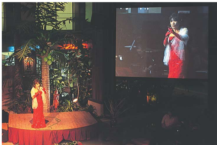
シーンに合わせて、スクリーンの映像を効果的に切り換えます。

また、カメラポジションのプリセット機能を最大限に活用し、臨場感のある映像を撮影するカメラポジションを設定することによって、全景、バーストアップ、手元へのズーム、サイドからのアップなどが3台のカメラで簡単に撮影できるようになりました。