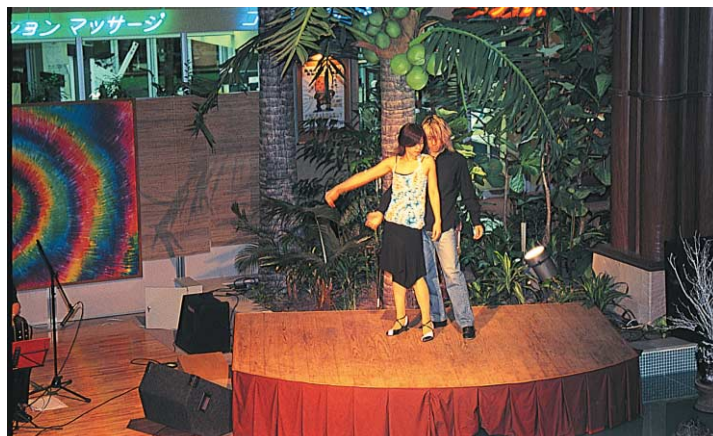
ライブatカフェラジャの1シーン

このコンテンツは、平日やライブのない時間帯にステージ脇に設置された大型スクリーンに映し出しされ、カフェの演出効果を高めています。