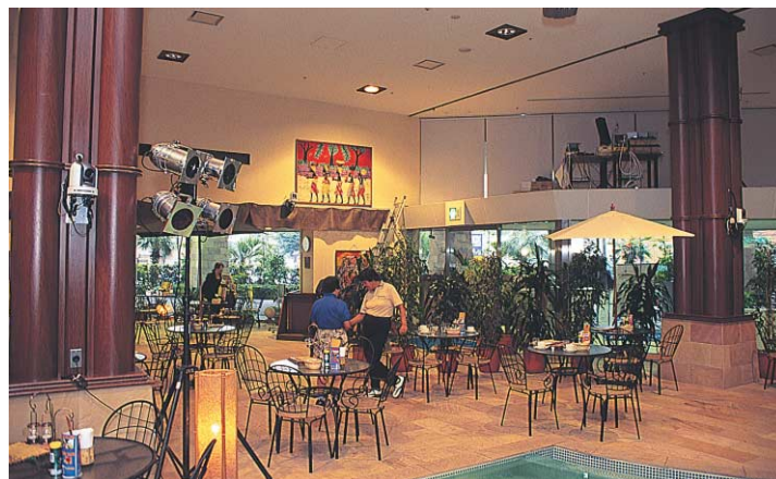
無料ライブが楽しめるカフェラジャ

このコンテンツは、平日やライブのない時間帯にステージ脇に設置された大型スクリーンに映し出しされ、カフェの演出効果を高めています。