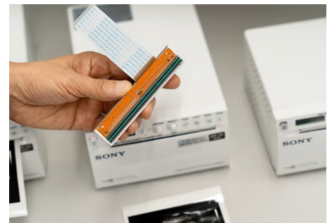
ソニーのメディカルプリンター UP-898 シリーズに搭載されているサーマルプリントヘッド