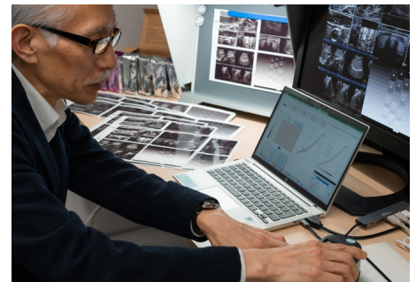
階調再現性を確認している様子