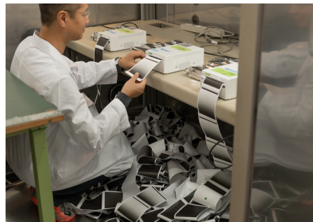
環境負荷をかけ大量のプリントを実施して、動作、画質の劣化がないことを検証