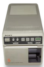
超音波診断器用 サーマルビデオプリンター 「UP-811」