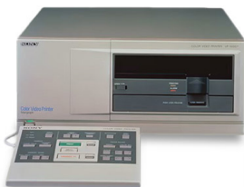
医療用 A5 カラー ビデオプリンター 「UP-5000」