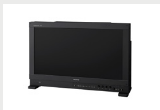
31型4K液晶マスターモニター