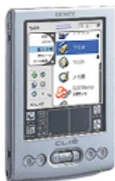
フロスティ シルバー(S)