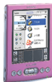
フラミンゴ ピンク(P)

「クリエ」TJ専用のキャリングケースPEGA-CA33（別売）も6色のカラーバリエーション。