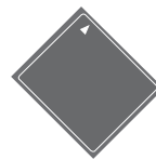
コンパクトフラッシュ