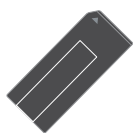
“メモリスティック PRO”