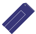
“メモリスティック”

幅広い記録メディアに対応 さまざまなデジタルスチルカメラで撮影した写真をプリントできます。