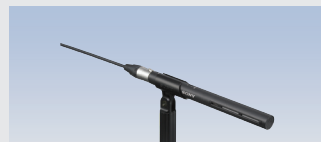
エレクトレットコンデンサーマイクrohnp ECM-VG1 希望小売価格 27,830円(税込)