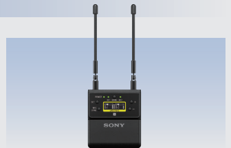
ポータブルダイバーシティチューナー URX-P41D 希望小売価格 121,000円(税込)