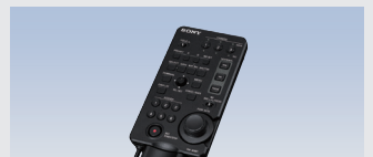
リモートコントロールユニット RM-30BP 希望小売価格 121,000円(税込)