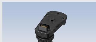
マルチインターフェースシューアダプター SMAD-P5 希望小売価格 7,700円(税込) UWP-D21/D22、URX-P41D用MIシューアダプター