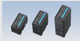
リチウムイオンバッテリーパック BP-U35 希望小売価格 19,250円(税込) BP-U70 希望小売価格 38,500円(税込) BP-U100 希望小売価格 55,000円(税込)