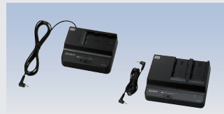
バッテリーチャージャー* BC-U1A 希望小売価格 22,000円(税込) BC-U2A 希望小売価格 39,600円(税込)