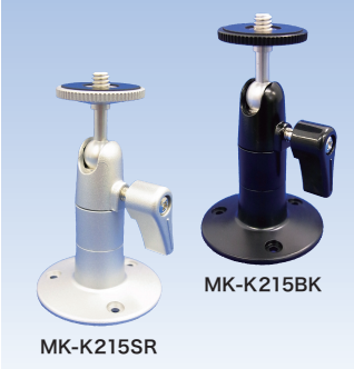
カメラブラケット MK-K215BK(ブラック) MK-K215SR(シルバー) 各希望小売価格 4,000円+税 (株式会社 武蔵野技研製)