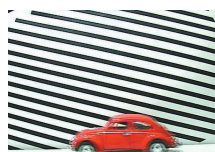
フレーム処理による映像

映像内の動きのない領域にはフレーム処理を、動きのある領域にはフィールド処理を行うことによりアナログカメラの映像を高画質で送信します。