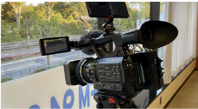
PXW-Z280 による収録中のファイル転送