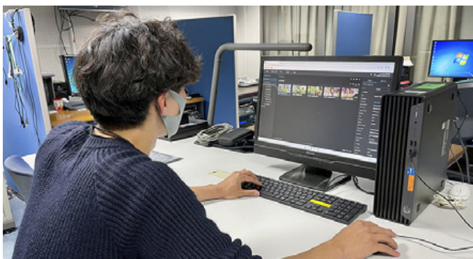
本社での伝送素材の確認、ダウンロード作業の様子

通常、選挙特番における取材現場でのメディア運搬方法は、ライブ中継している場所を除き、1つの取材が完了する度にバイク便を活用し、本社や支局、またはライブ中継をしているクルーの場所などから伝送するケースも多いです。また、複数の現場クルーで機材を共有しながら運用するため、彼らには経験値が求められますが、選挙は4年に1回程度なため、スタッフの入れ替わりなどの要因で、選挙特番の経験を持たないクルーが対応することもあります。これらの懸念を C3 Portal は解消してくれました。