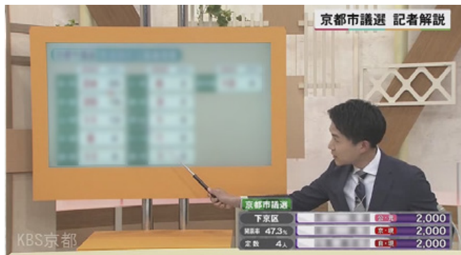
選挙特番のOAの様子

今回は 4G / 5G モバイル回線を用いて、OA 用途を想定した品質のプロキシ (XAVC Proxy / 6 Mbps) でファイル転送を実施しました。『PXW-Z280』に搭載されているチャンク転送の機能を使って、収録中でも C3 Portal でファイル転送を行うことができたため、伝送された素材は当日の選挙特番の中で OA することができました。