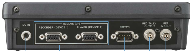
DC IN 12 ~ 15V REMOTE (9P) RS-232C (メンテナンス用) REC TALLY 出力 REF IN/OUT