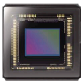
5.9 mm × 4.4 mm