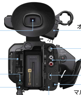
マルチ/マイクロUSB端子