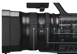
3ポジションNDフィルター (1/4ND、1/16ND、1/64ND)

独立3連リング付Gレンズを搭載。業務用カメラとして重要なマニュアル操作をしやすいようフォーカス・ズーム・アイリスの3つのリングを独立して備えたレンズを採用しました。広角29mm(35mm換算)、光学12倍ズームのレンズには従来のワイドコンバージョンレンズVCL-HG0872Kを取り付けることも可能です。