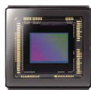
4.8 mm × 3.6 mm