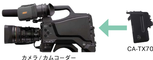
カメラ/カムコーダー

カメラ/カムコーダーのバッテリー取り付け部に装着し、50ピンインターフェースを介してケーブルレスで接続することができます。CAの脱着が容易である上、信頼性の高いシステムカメラ運用を可能にします。