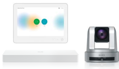
Webex Room Kit Plus SRG-120DHセット