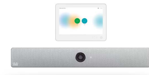
Webex Room Kit