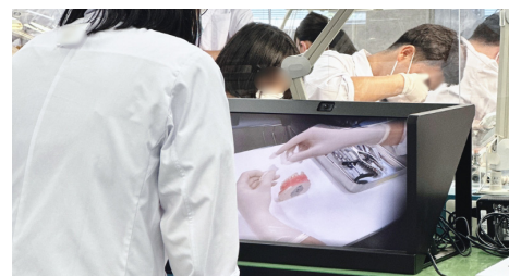
実習で学生が SRD を活用する様子