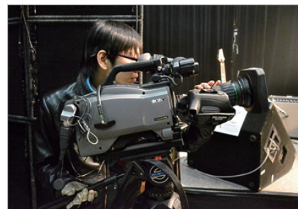
スタジオでの実習風景

今回スタジオカメラとして導入したHSC-300/HXC-100は、2011年11月からさまざまな制作実習で運用を開始しました。メインとなるのは週に1、2回の番組制作実習です。スタジオ/スタジオサブ、編集室をフルに活用した実習で、ライブ番組や収録番組の制作を行います。ワイドショー的なものから、通販的なものなど多彩な番組をこのカメラを使って撮影しています。中継を必ず入れた番組構成とするといった課題もあり、より実践的なカリキュラムとなっています。